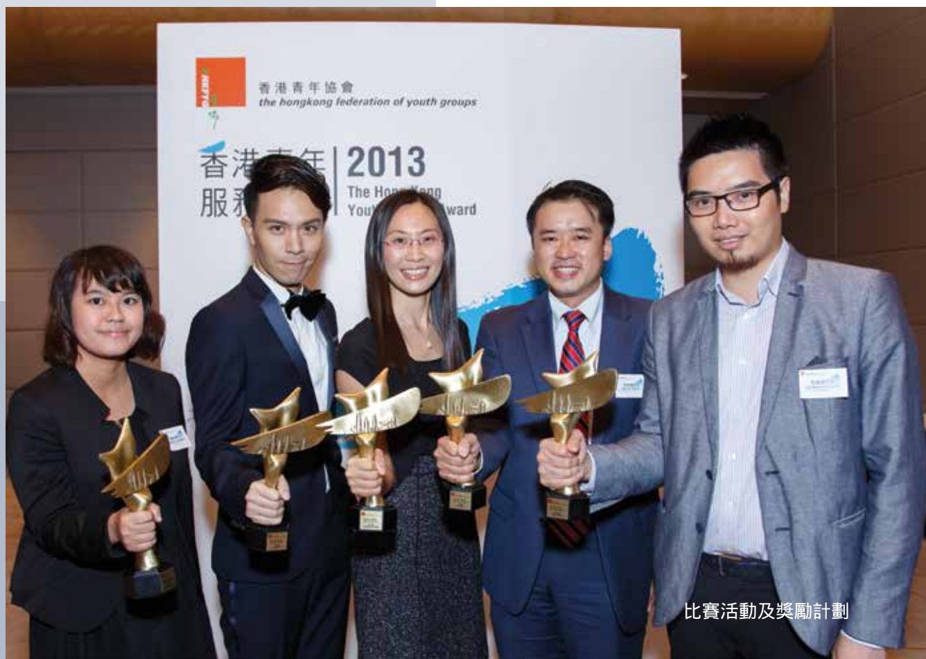
比賽活動及獎勵計劃